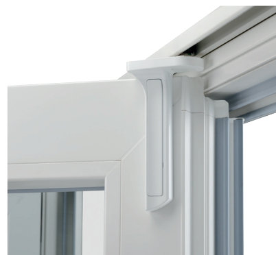
Supports solides : pour des vantaux hauts et lourds

Roto Patio Fold répond non seulement à des exigences élevées en termes de technologie et de confort, mais il se distingue également par un design attrayant : fin, élégant, et disponible en divers coloris. Ce ferrage premium pour système pliant-coulissant s'ouvre à de nouvelles dimensions de conception. Roto Patio Fold – le système pliant-coulissant qui répond aux plus hautes exigences.