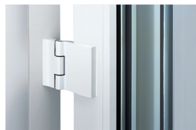
Paumelle de dormant : réglable et laquée